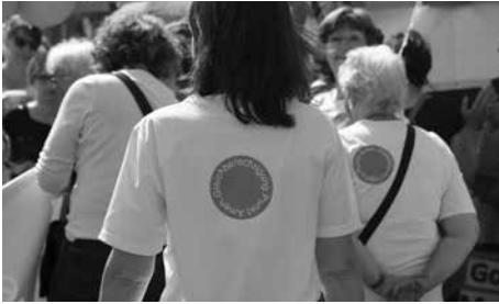
Gleichberechtigung.Punkt.Amen am Frauenstreik / Egalité.Point.Amen à la grève des femmes