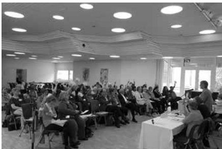
Abstimmung an der Delegiertenversammlung / Votation lors de l'assemblée des déléguées

Conformément à la devise annuelle «Les femmes changent le monde», les personnes présentes ont eu un aperçu des projets de femmes qui réalisent de grandes choses à petite échelle. Les différents stands du marché ont invité à échanger et à discuter.