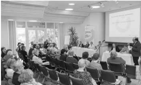
Grussworte an der Delegiertenversammlung / Mots de salutations à l'AD