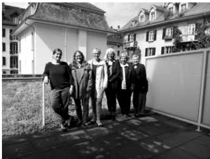
Die EFS und der SKF haben ihre Zusammenarbeit geregelt / Les FPS et la SKF ont défini leur collaboration

Die zehn Besuche bei weiteren Organisationen und Schwesterorganisationen erweitern und stärken die bestehenden Beziehungen und ermöglichen den Austausch über aktuelle Themen sowie punktuelle Kooperationen.