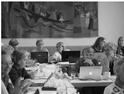
Am Weiterbildungstag / A la journée de formation continue

Délégations Le Comité central a visité trois associations nationales, huit cantonales et sept locales. Ces visites sont importantes et appréciées. Elles permettent au Comité central de se faire une idée du travail des associations membres, de leurs activités et de l'orientation de leur association faîtière. Les dix visites à d'autres organisations et organisations sœurs élargissent et renforcent les relations existantes et permettent un échange sur des sujets d'actualité ainsi qu'une coopération ponctuelle.