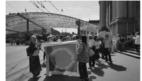
Am Frauentreik in Bern / A la grève des femmes à Berne