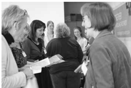
An den Marktständen entstanden interessante Diskussionen / Des discussions intéressantes au stands du marché

Gemäss dem Jahresmotto «Frauen verändern die Welt» erhielten die Anwesenden Einblicke in Projekte von Frauen, welche im Kleinen Grosses bewirken. Die verschiedenen Marktstände luden ein zu Austausch und Diskussion.