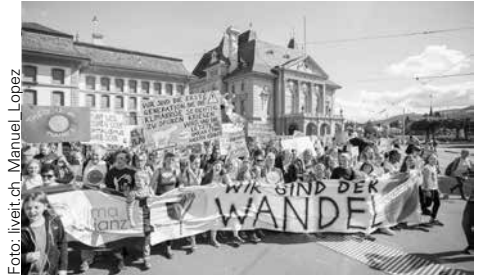
Mit dabei an der Klimademo im September / Au manif pour le climat en septembre